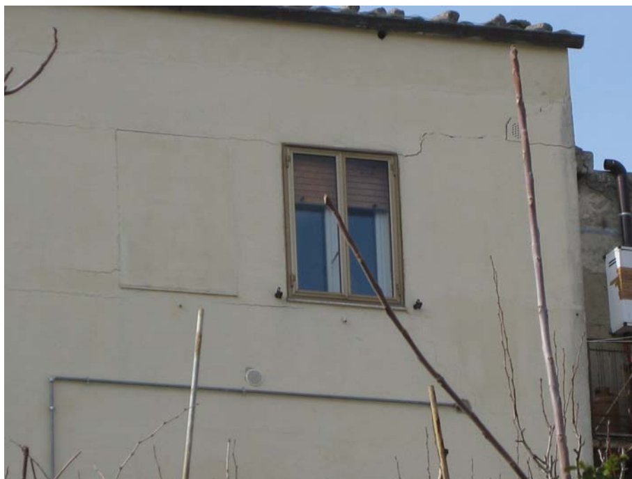
Fig. 3 – Lesione sub-orizzontale presente in uno dei fabbricati interessati dal processo dissestivo complesso