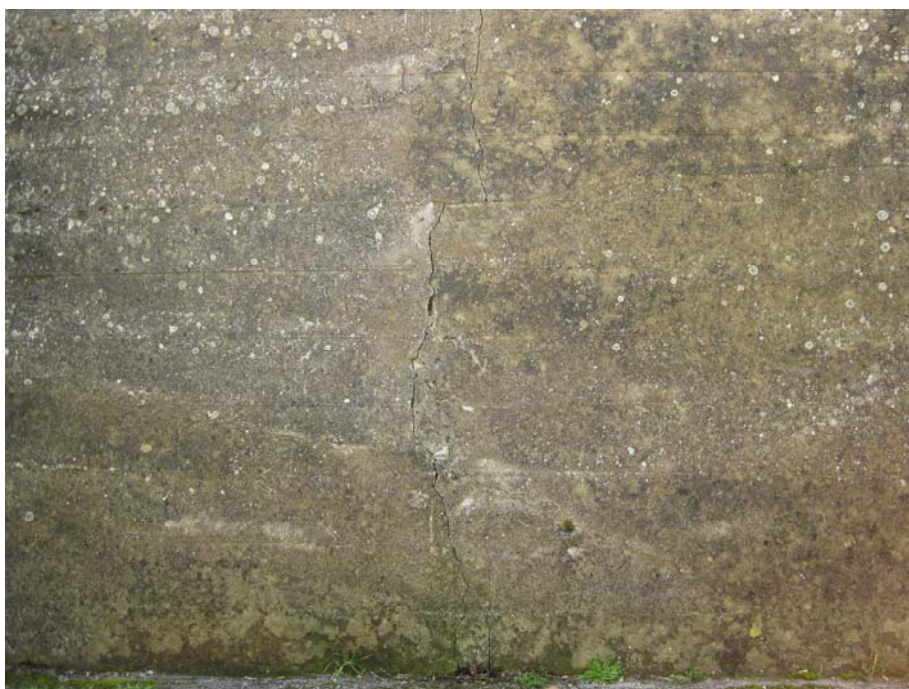
Fig. 2 – Particolare di una lesione sub verticale in corrispondenza del muro di c.a. localizzato in via Puccini