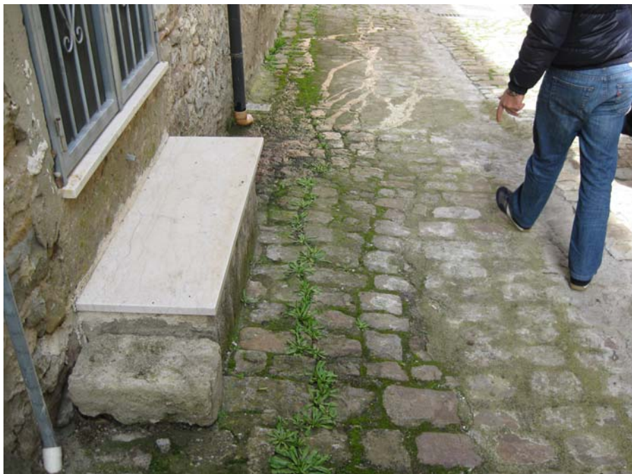
Fig. 1 - Lesioni e cedimenti in corrispondenza della sede viaria urbana di via Grazia Deledda (centro abitato)

Lo stato fessurativo rilevato e le condizioni geologico-morfologiche del sito inquadrano il processo geomorfologico in atto in una frana complessa (T2) attiva, che non essendo censita nel PAI in vigore, si è identificata con il codice 072-6CE-120.