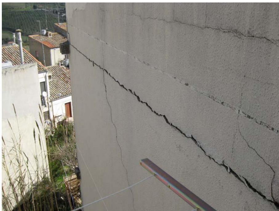
Fig. 4 – Particolare dall'alto della lesione beante sub - orizzontale presente nell'edificiodi cui alla foto n. 3